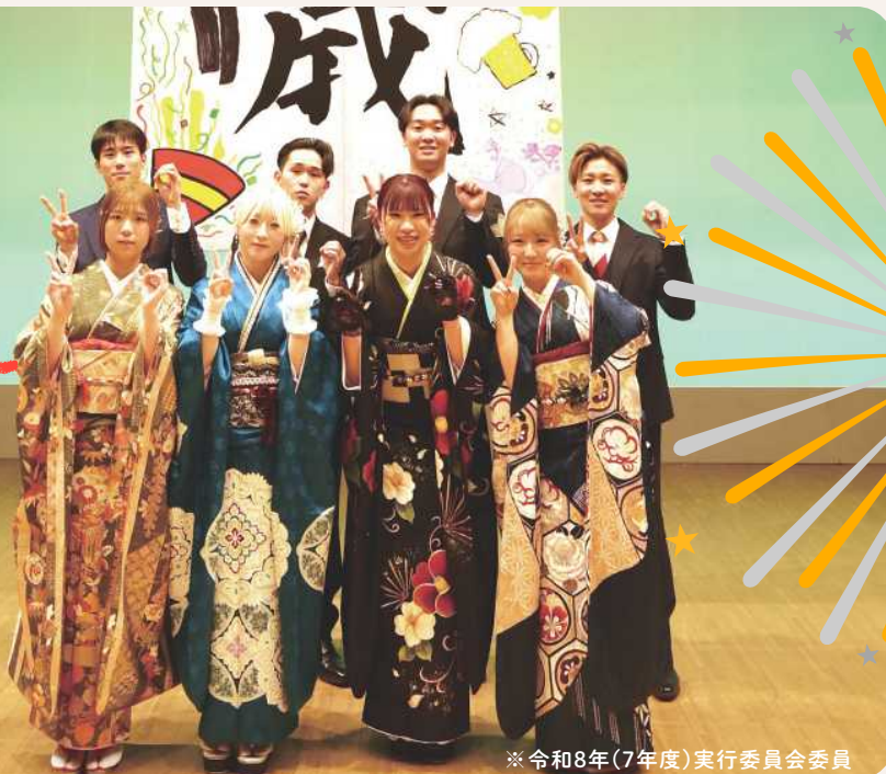
※令和8年(7年度)実行委員会委員