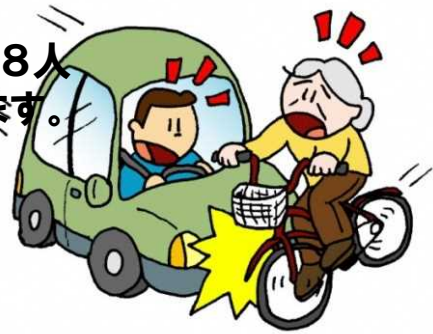
自転車乗用中死者の損傷部位(過去5年)

過去5年で、自転車運転中に亡くなった高齢者58人のうち 6割以上(35人) が 頭部に致命傷 を負っています。