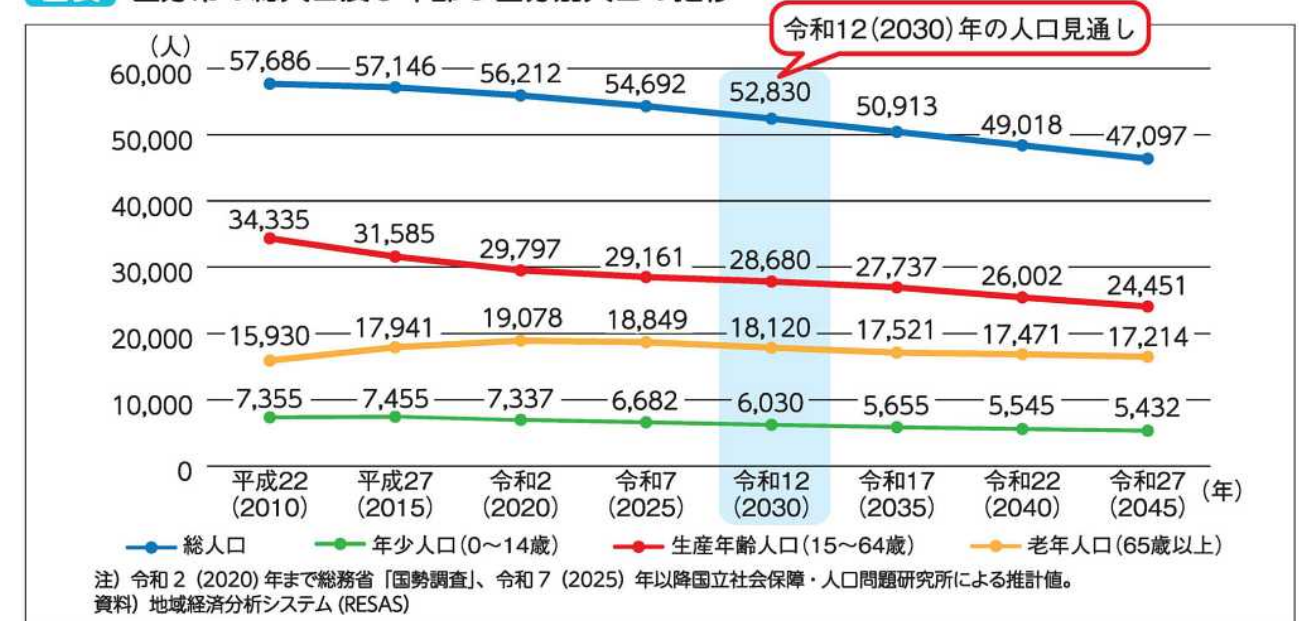
図表 直方市の総人口及び年齢3区分別人口の推移

人口減少の進展により、担い手不足による地域コミュニティや自主防災組織の機能低下、消費の減少による経済や産業活動の縮小、空き家の増加による住環境の悪化など、市民生活や地域経済への様々な影響が想定されます。そのため、企業誘致や産業振興などによる雇用の場の確保や暮らしやすいまちづくりを推進し、地域で育った若者が、地域で働き、暮らし続けられる環境を整備することで、地域のにぎわいを創出し、活力あるまちづくりを目指します。さらに、健康づくりに関する取り組みの充実など高齢者の健康寿命 1) の延伸や、子育てや教育環境の充実など将来のまちづくりを担う子育て世代の定住促進に取り組むことで人口減少の抑制を目指します。