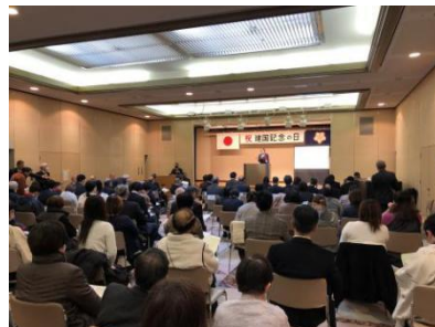
令和7年 施 光恒氏（九州大学大学院 教授）による記念講演