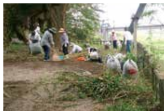
樹齢千年大銀杏の清掃活動