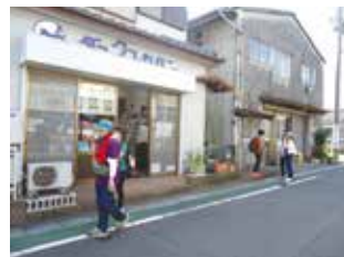
ランドセルの製造販売店