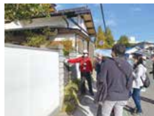
著名な作家「伊馬春部」の額