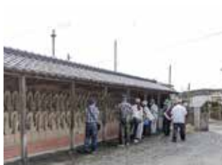
今宮大師・四国札所