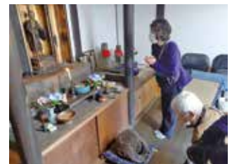
文化財・空也上人像