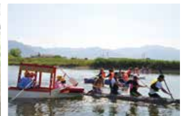
犬鳴川のかだフェスタ