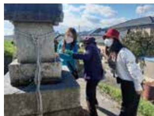
久留米水天宮の分社