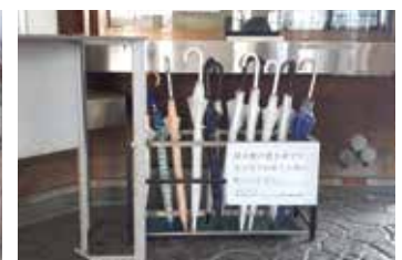
植木駅に置き傘設置