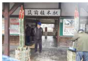
植木駅舎の門松設置