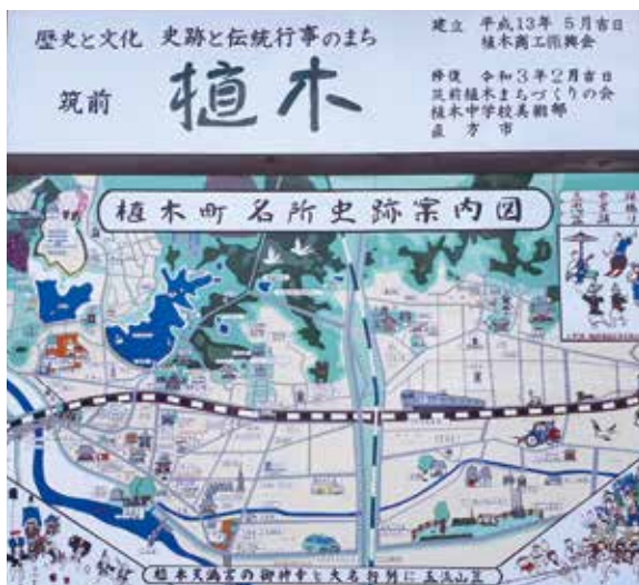
植木中学校生徒による名所史跡地図の修復