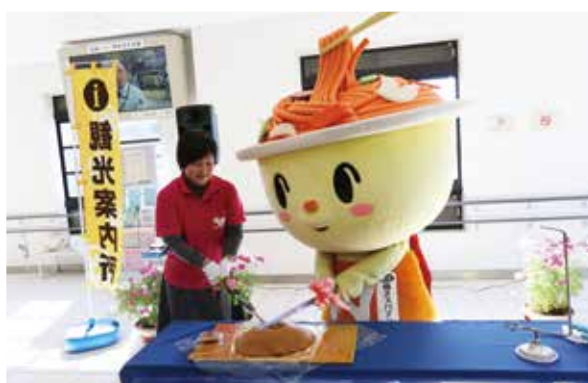
焼きスパマンも観光案内所をバックアップ