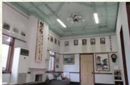
▲本館1階奥の展示室