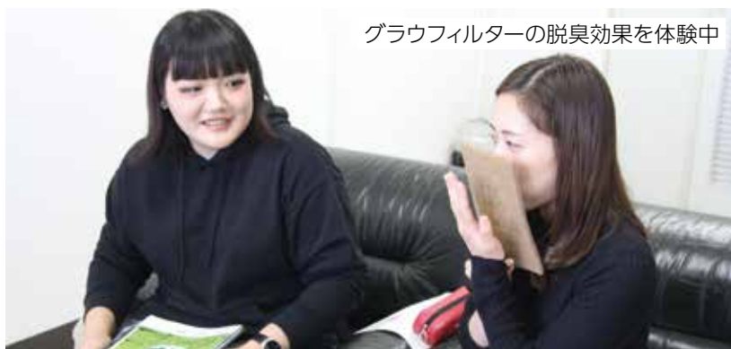
グラウフィルターの脱臭効果を体験中