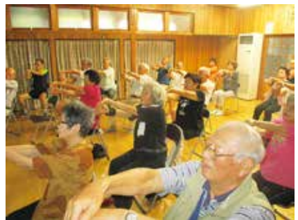
背筋ピン腕もピン。これがピンピンコロリの近道。