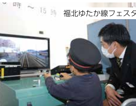
福北ゆたか線フェスタ (直方車両センター)