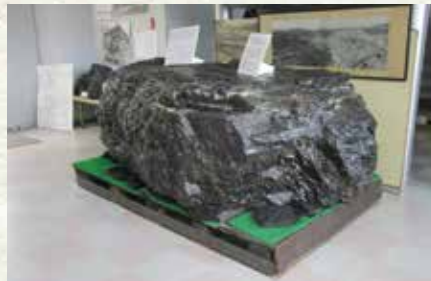
▲上穂波炭坑で掘り出された巨大な石炭塊 （新館1階）