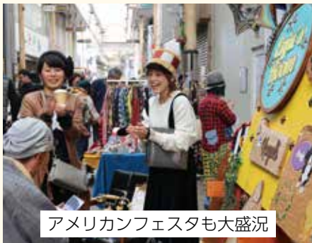
アメリカンフェスタも大盛況