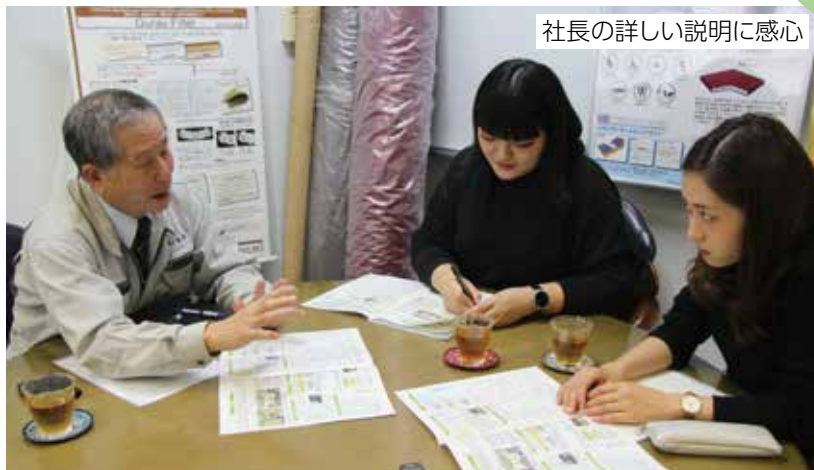
社長の詳しい説明に感心