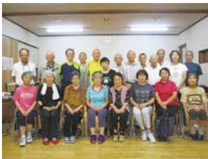
まるで中学校の卒業写真みたいですね？