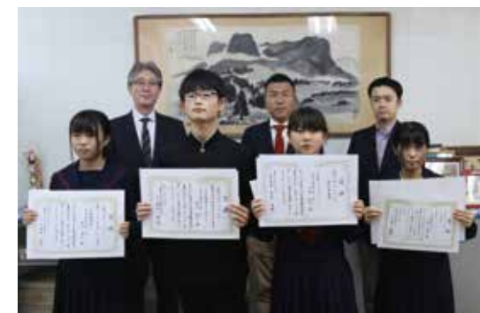
素敵アイデアがたくさん寄せられました

《次世代産業研究会会長賞》 災害時用キーホルダー：GPS内蔵のキーホルダーで、持ち主の位置や天気、時間などがリアルタイムで分かる。消防署などに直通する安否を確認するボタンや、AM・FMラジオも内蔵している。