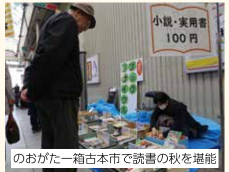
のおがた一箱古本市で読書の秋を堪能