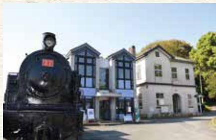
▲直方市石炭記念館全景 …右端が旧筑豊石炭鉱業組合直方会議所（本館）

かつて、炭坑経営者たちが激論を戦わせた本館の2階には、軍艦島と呼ばれる長崎県端島炭坑、旧筑穂町にあった嘉穂鉱業所などの、稼働中の時代に使われた様々な炭坑模型が展示されています。当時の状況を知ることができる重要な資料群です。