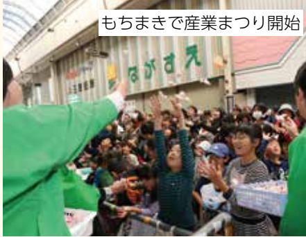
もちまきで産業まつり開始