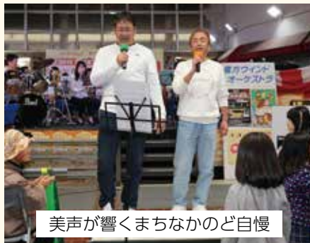
美声が響くまちなかのど自慢