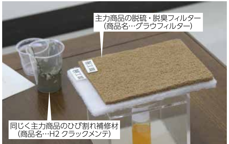
同じく主力商品のひび割れ補修材 (商品名…H2 クラックメンテ)

A4 実力があるのはもちろん良いのですが、私は「運」が強い方と仕事を一緒にしたいと思っています。いくらスキルやコミュニケーション能力に長けていても、我が社にとって重要な人物とどう巡り合えるかについては「運」が大切だと考えています。(波多野専務)