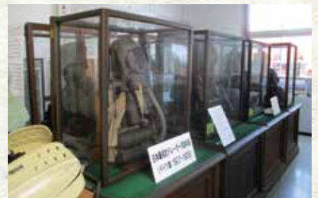
▲筑豊石炭鉱業組合が所蔵していた救命器群 （本館1階）