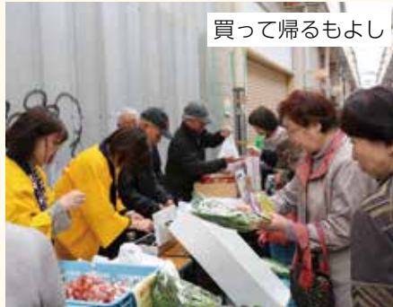
買って帰るもよし