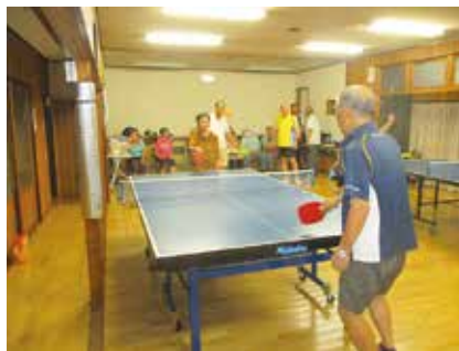
まだ若い人には負けんバイ。来年は市長杯に出るさね。