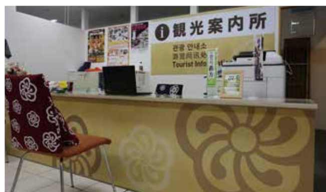
渋い色味の大人っぽい雰囲気