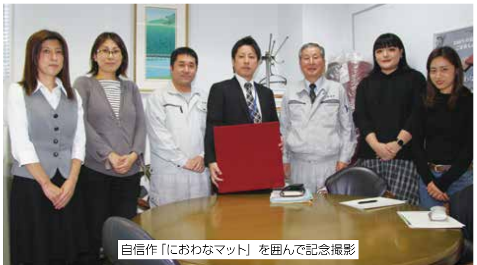
自信作「におわなマット」を囲んで記念撮影