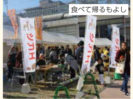
食べて帰るもよし