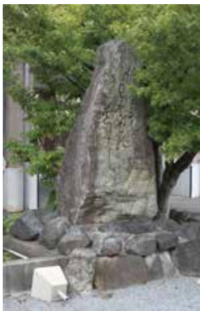
二蕉庵直峰の句碑

俳諧の系図では、芭蕉から数えて十代目となる旧派俳諧の、直方における最後の伝承者として、玄海吟社