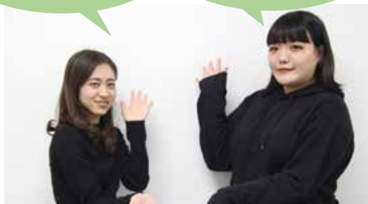
私たちがインタビューします！