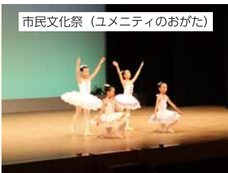
市民文化祭 (ユメニティのおがた)