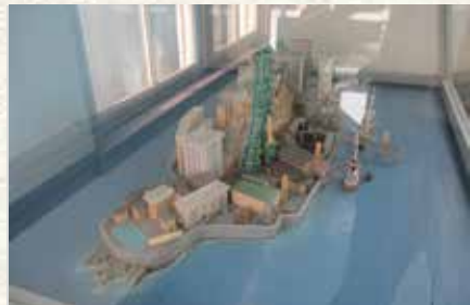
▲稼働時に使われていた軍艦島の模型（本館2階）