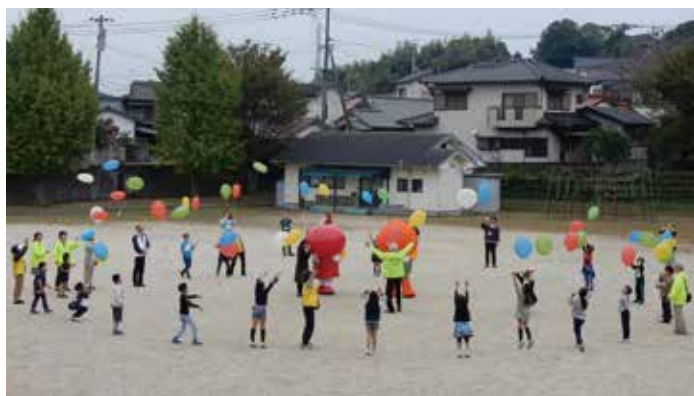
誰が拾ってくれるかな

児童たちは風船を手に校庭に集合。合図とともに一斉に風船を空に飛ばすと、風船はみるみる空へ舞い上がっていきました。児童らは「バイバイ」と大きな声を上げながら、風船の行方を見守っていました。