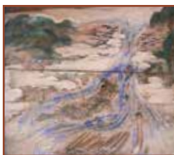
遠賀川かわひらのたの絵馬 植木天満宮 (直方市教育委員会蔵)