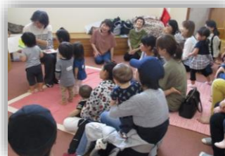
図書館「麦のこ」お話し会